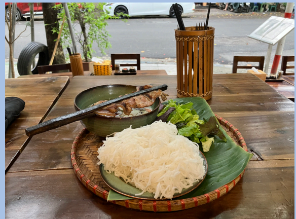
<写真3> ハノイの道路に面したオープンレストランで食したブンチャー。数百円

ということでシンガポールを脱出しての各国ですが、不動産投資の観点から見ると、交通渋滞の慢性化は公共交通インフラの整備遅れ(=都市計画に係る国の指導力不足?)を浮き彫りにしていて、特にオフィスや物流セクターについては