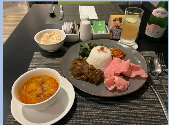
<写真5> ジャカルタのルンダン。付け合わせのスープも美味しい