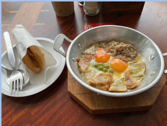
<写真4> バンコクのカイガタ。味も美味しいが、味のある鍋もよい。数百円

小さい専用浅鍋に目玉焼きとソーセージやひき肉が入ったローカルな朝食(「カイ」は卵、「ガタ」は鍋の意味)。ソーセージが甘めに味付けされていて、甘醤油のような調味料「マギー」をかけて食べる