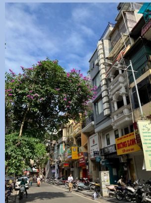
<写真2> 同じくハノイ旧市街。街路樹のピンクのサルスベリの花が美しい