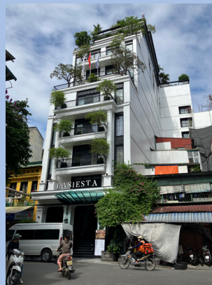
<写真1> ハノイ旧市街のブティックホテル。中は綺麗にリノベされているが建物の構造上窓無し部屋もあり

シンガポールにしかないと思っていたショップハウス(チューブハウスとも呼ぶらしいです)は東南アジア各国でも見られますが、昔どこの国の植民地であったかにより趣が異なり、個人的にはフランスの影響を色濃く残すハノイの旧市街が一番好きです(写真1・2、英国系の画一的なシンガポー